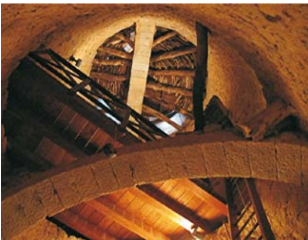
Interior de la torre

Als peus de la torre hi ha un petit cementiri, al seu costat l'església de Sant Pere, d'estil barroc, més enllà l'antiga rectoria, un carreró, unes cases... Tot ara en ruïnes, excepte la magnífica torre, que ha continuat dempeus malgrat el pas dels anys. En l'indret hi trobem restes de construccions romanes i d'un poblat medieval.