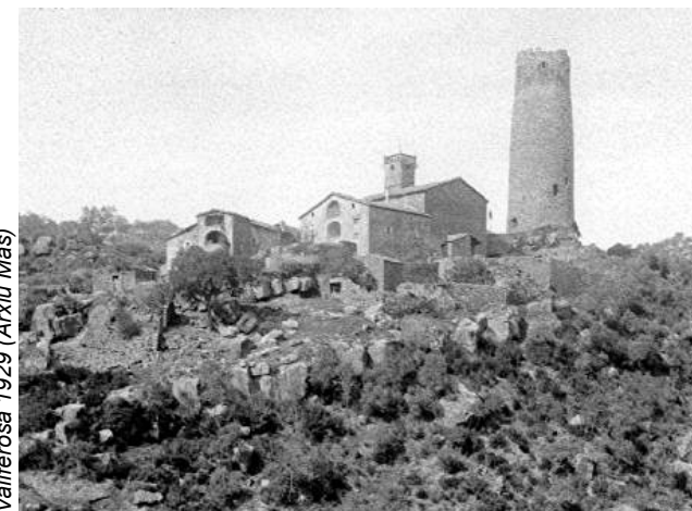
Vallferosa 1929