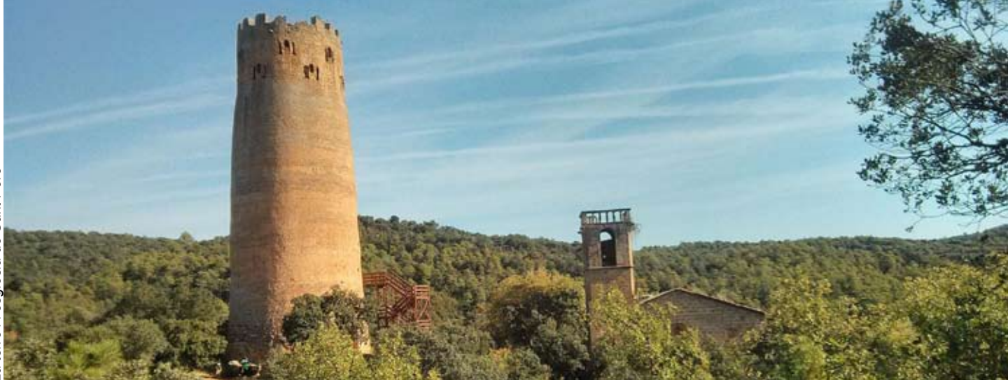
La torre i l'església de Sant Pere

La seva situació és peculiar: enclotada en una vall, envoltada d'un bosc feréstec, però dominant el pas que porta de les terres planes de l'interior cap al Prepirineu.